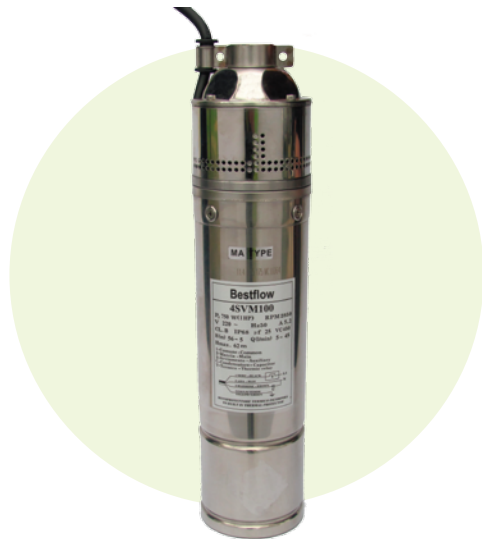
4SVM100 (1.0 HP)